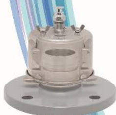
マルチストップバルブ NEO