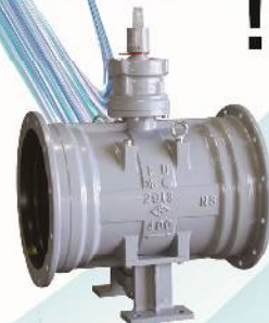
耐震NS形バタフライ弁