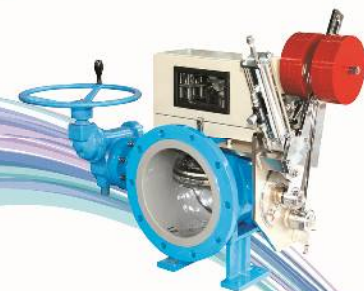
ドローバルブ(緊急遮断弁)