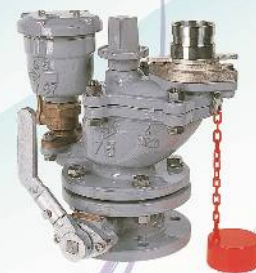
エポラリット消火栓