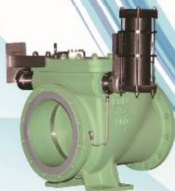
フロップ吐出用逆止弁