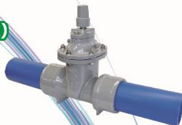
ポリエチレン管一体形リポートバルブ仕切弁