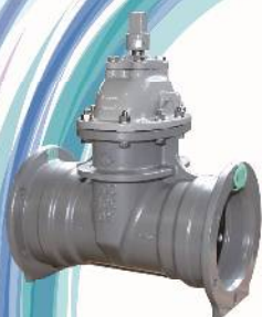
耐震GX形リポートバルブ仕切弁